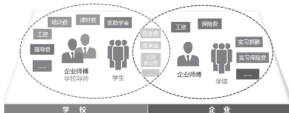
图3 校企合作成本分担机制

编》,为项目的开展提供了制度的保障。按照利益共享的原则,企业承担师傅和学徒的薪资待遇,以及各类活动的比赛奖励,学校承担学生的奖助学金、教师师傅的课时费、培训费、报告费等相关费用。校企共同分担实训室建设费用,形成了企业愿担、学校愿投成本分担机制。在学徒培养的全过程,校企双方共同投入,建立了学徒培养的成本分担机制。学校负责学徒在校公共课、基础课程教学、专业理论及校内实践教学,完成学徒的基本技能训练,企业兼职教师承担部分校内实训、企业文化教育、岗位初识、技能竞赛指导、职业资格辅导等。企业兼职教师(师傅)的课时费和指导费由学校承担,企业师傅的工资和保险由企业负责;学徒岗位实习的薪酬和实习保险费等主要由企业承担,企业师傅的指导费由学校支付相应的课时薪酬;常驻学校的企业兼职教师(师傅)和校内导师的培训费用由学校承担;设立企业奖助学金,校内实训基地双方共建共享;学校协助合作企业落实国家实施现代学徒制税收优惠政策。