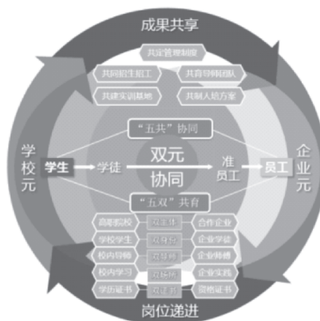
图2 现代学徒制人才培养模式图

凝练形成“企业和学校双主体、学生和学徒双身份、学校教师和企业师傅双导师、毕业证和职业资格证书双证书、校内教学和企业实习双场所，校企共制人才培养方案、共定管理制度、共同招生招工、共建实训基地、共育导师团队”的“五双五共”现代学徒制人才培养模式，双招同步，模块教学，岗位递进，成果共享。