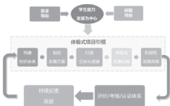
图4 项目体验育人平台

以企业需求为导向,以学生能力发展为中心,打造项目体验式育人平台:(1)构建知识体系;(2)制定实施方案;(3)打造立体化资源;(4)开展体验式实施过程;(5)评价阶段性实施效果。阶段性实施效果的对象包括:单一任务项目、综合任务项目、毕业设计项目、创新创业项目等。